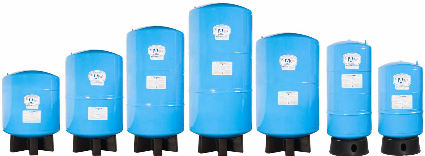
TANQUES VERTICALES DE ACERO PRECARGADOS (DIAFRAGMA) ALTAMIRA Serie PRO-X (100 psi)