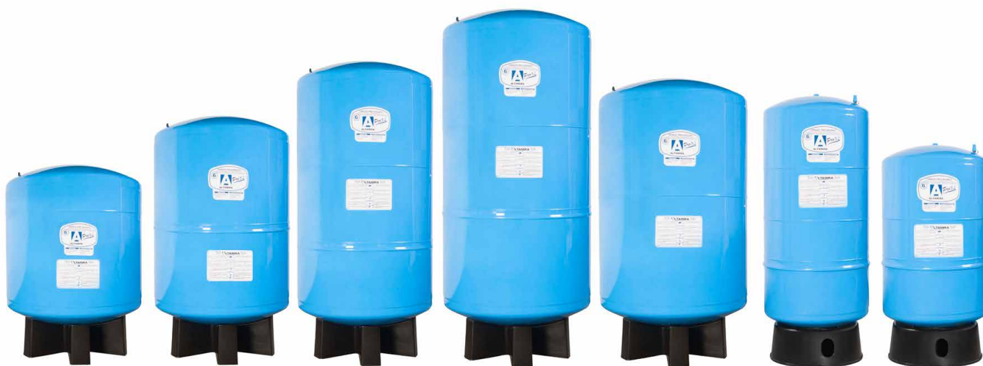
TANQUES VERTICALES DE ACERO PRECARGADOS (DIAFRAGMA) ALTAMIRA Serie PRO-XL (125 psi)